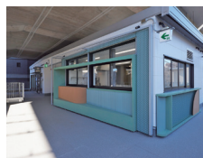
通路に面した販売スタンド