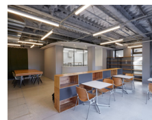
カフェスペースと大テーブル(20席)